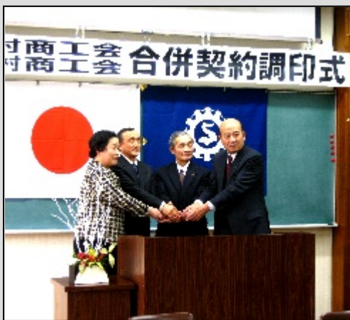
調印後に握手を交わす両村の商工会長と村長

10月には両村の社会福祉協議会の合併調印も行われており、今後も市町村合併にあわせ、両村内にある各団体の合併や統合が進められる予定です。