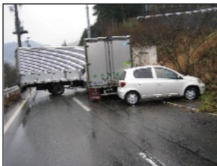
12月17日に発生した事故の様子

これからの時期、降雪や凍結によりたいへん道路が滑りやすくなります。また、県外から訪れるドライバーの中には、冬の道路の運転に慣れない方もいます。自動車の運転をする場合は、スピードを落として車間距離をとるなど、十分に注意していただきますようお願いいたします。